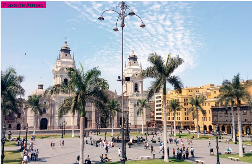
Plaza de Armas

Es un complejo religioso que data del siglo XVI pero al que se le fue dando forma a lo largo de la historia debido a los terremotos que asolaron Lima y a los cambios que propiciaron los religiosos que vivieron en el lugar. Es otro templo que no se debe dejar de lado en una visita a la ciudad. Desde allí podemos caminar hacia otros cuatro lugares interesantes por su arquitectura: el Teatro Municipal de Lima; la Iglesia de las Nazarenas y santuario del Señor de los Milagros; el Santuario de Santa Rosa de Lima y el Teatro Segura, del siglo XVIII y quizá uno de los más antiguos del continente. En las iglesias limeñas, abunda el barroco fundido con el colorismo indígena y un aire de riqueza de la época del esplendor y gloria de los