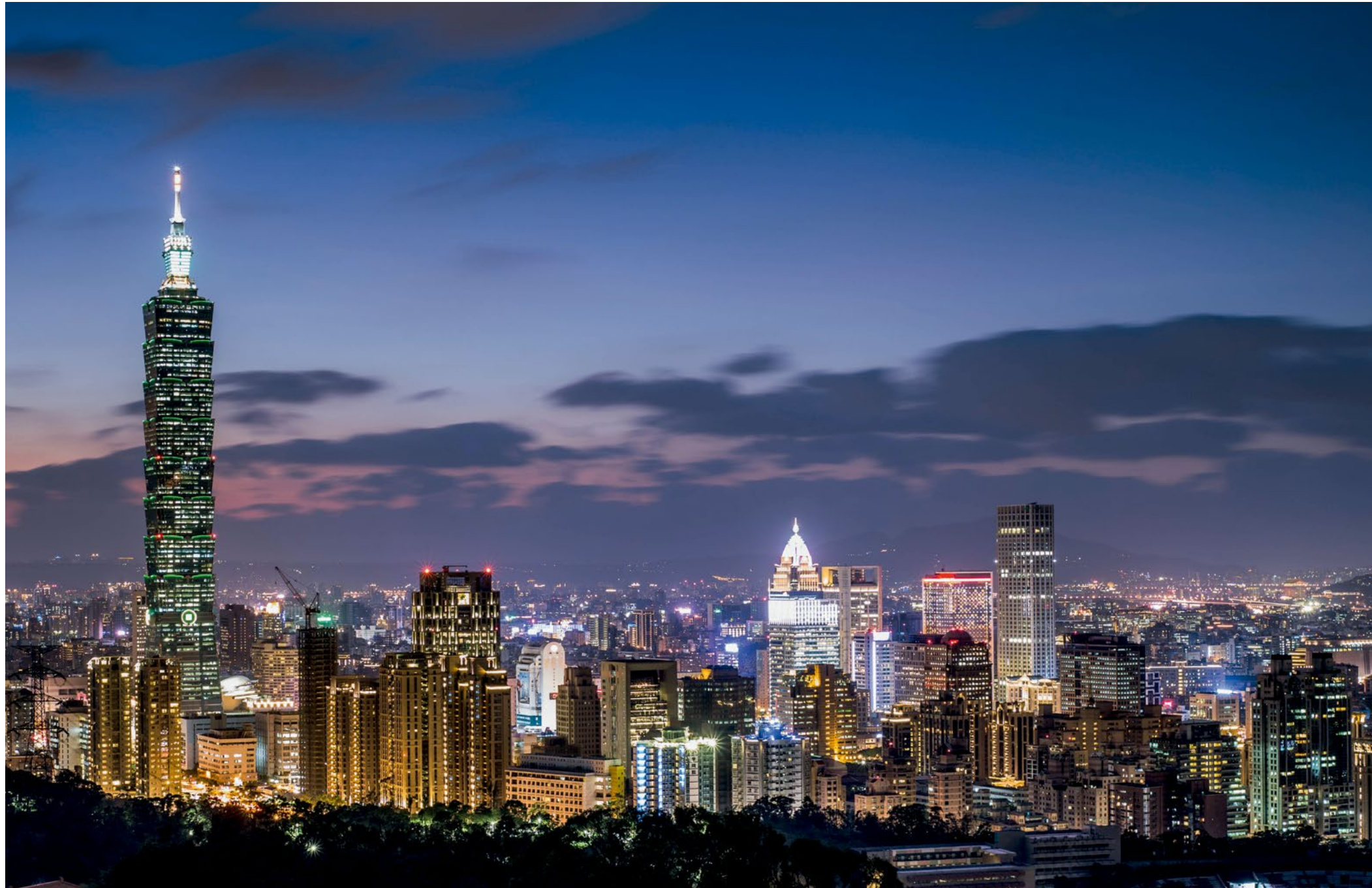
1. Taipei, capital de Taiwán.