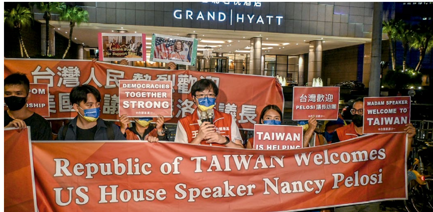
2. Un grupo de manifestantes dio la bienvenida a la presidenta de la Cámara de Representantes de EEUU, Nancy Pelosi, frente al hotel Grand Hyatt Taipei, el pasado agosto.

Para la diplomacia china, la visita de Pelosi alimenta y alienta lo que considera las veleidades secesionistas del ejecutivo de Taipei. El ejército chino utilizó fuego real e incluso lanzó varios misiles balísticos cerca de las islas de Matsu, en aguas taiwanesas, generando el temor en la población de esta pequeña isla de apenas veintitrés millones de habitantes y 36.000 kilómetros cuadrados. Taiwán puso en estado de alerta a sus fuerzas y dijo estar preparada para responder una supuesta agresión militar china.