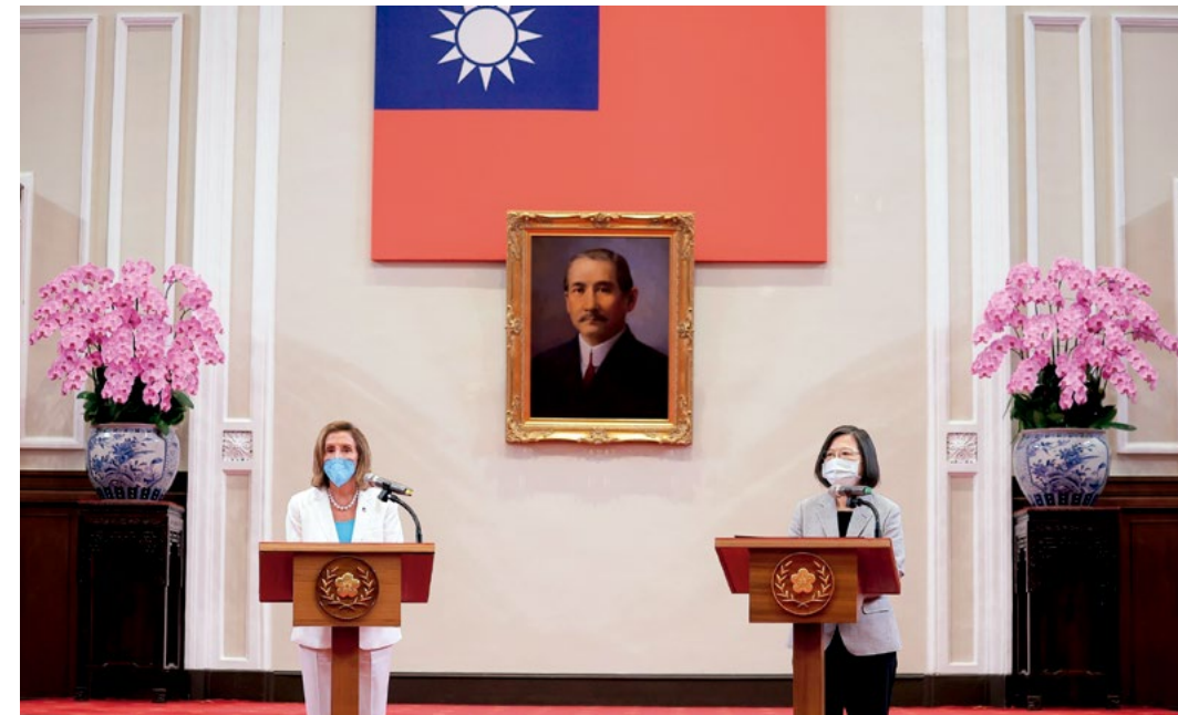
2. La presidenta de la Cámara de Representantes de Estados Unidos, Nancy Pelosi, a la izquierda, y la presidenta de Taiwán, Tsai Ing-wen, durante la rueda de prensa en Taipei.

En este contexto, hay que reseñar que los continuos sobrevuelos de aviones de combate chinos, incluidos bombarderos con capacidad nuclear, sobre el espacio de defensa aérea taiwanés, sin apenas respuesta por Taiwán que teme verse inmersa en un conflicto, preocupan al ejecutivo de Taipei y también a sus aliados norteamericanos. La cascada de transgresiones e incursiones ha ido en ascenso en los últimos meses y ha sido denunciado por Taiwán en repetidas ocasiones, que exhibe una contención frente a las provocaciones chinas digna de elogio. Las maniobras militares chinas de agosto de este año se inscriben en esta agresión soterrada y no directa de China contra Taiwán.