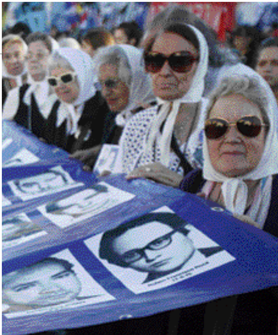
El movimiento de las Madres de Mayo destapó el drama de los desaparecidos.

Hay una gran disparidad en las víctimas que se ofrecen desde la izquierda, desde las Madres de Mayo, y desde otros colectivos.