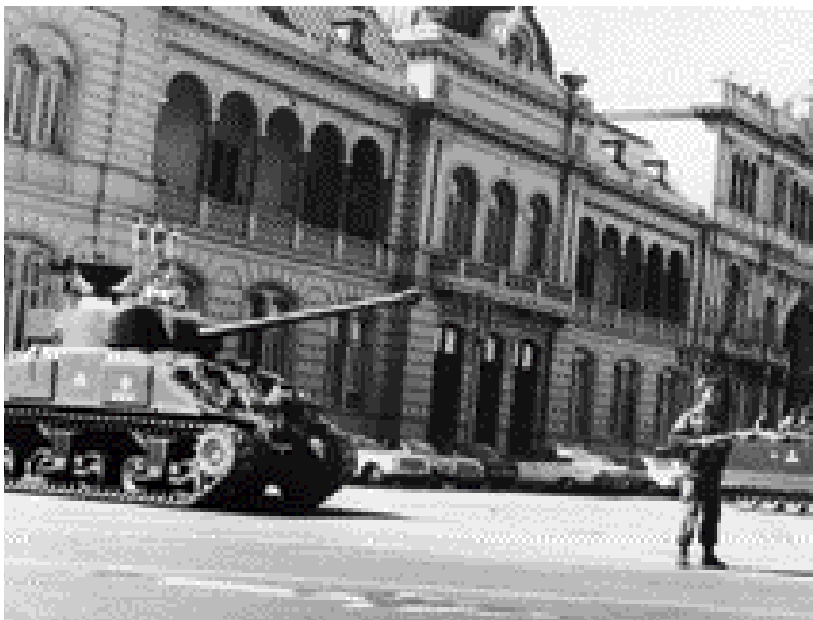
El golpe de Estado del 24 de marzo de 1976 trajo un periodo trágico para Argentina.

Había unidad total, sin ningún género de dudas. Así como la