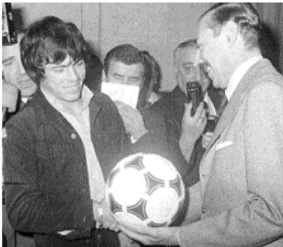
El Mundial de Fútbol del 78 hizo cómplice de la satrapía a la comunidad internacional.

La Iglesia cumplió con su deber, fue prudente, de tal suerte que