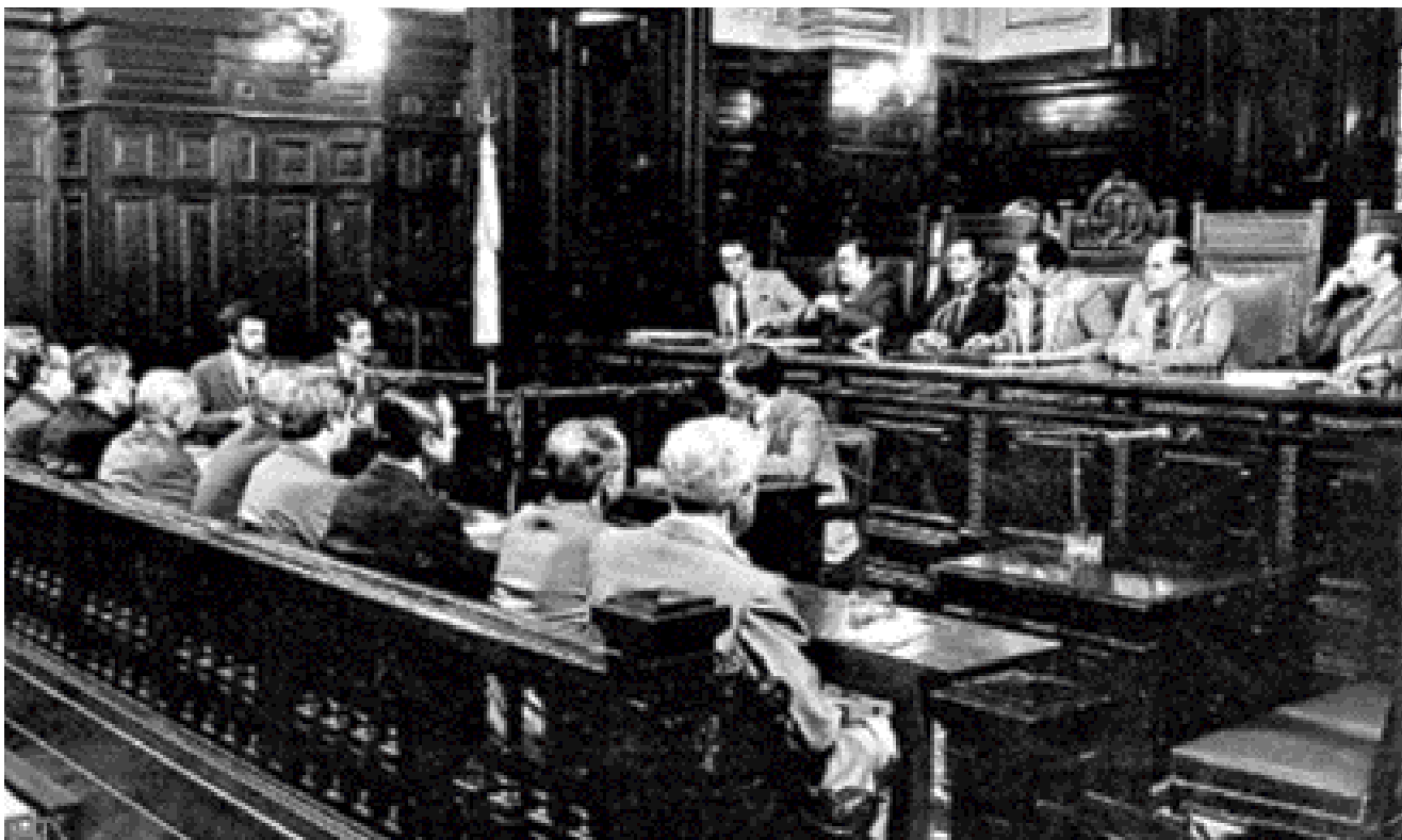
La justicia argentina ha actuado hasta ahora con relativa complacencia y tibieza contra los dictadores.

timos a una clara manipulación en el asunto de los desaparecidos, se trataba de alterar las cifras con un sentido político o con el interés de conseguir fraudulentamente una indemnización del Estado argentino. Fue un error de nuestra parte aceptar y mantener en el tiempo el término de desaparecido digamos como algo así nebuloso; en toda guerra hay muertos, heridos, lisiados y desaparecidos, es decir, gente que no se sabe dónde está. Esto es así en toda guerra.