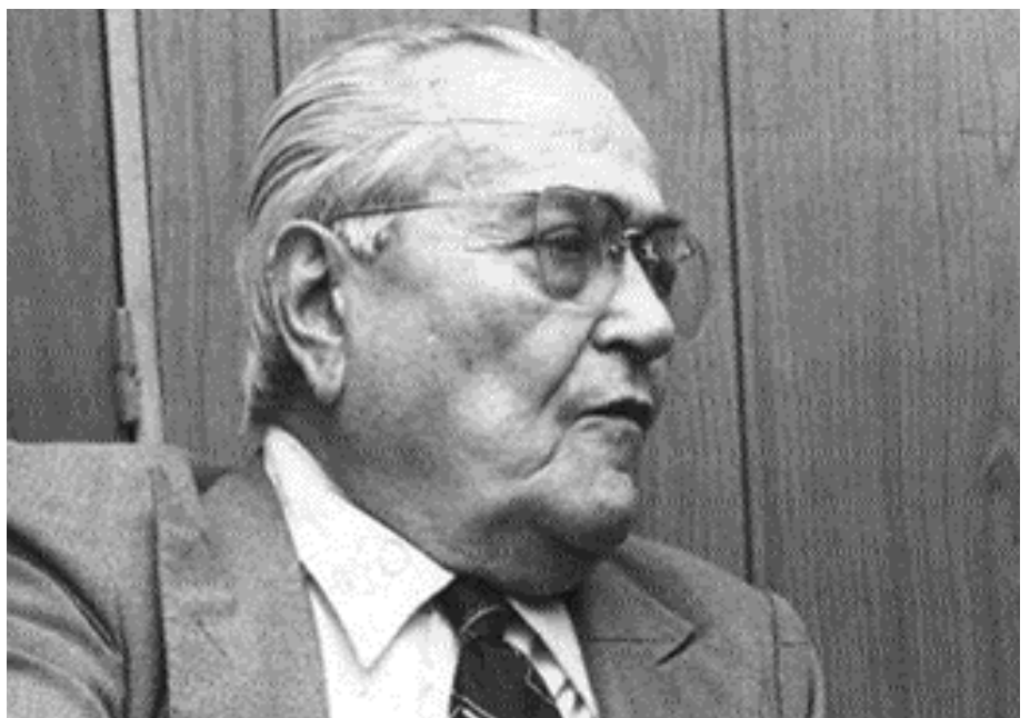
Ricardo Balbín, líder de la Unión Cívica Radical.

de marzo se produce el levantamiento militar. Y conforme a los estatutos fijados para reorganizar el Estado, el nuevo orden de conducción jefatura iba a ser la Junta de Comandantes en Jefe de las Fuerzas Armadas, de la cual dependía el presidente con las