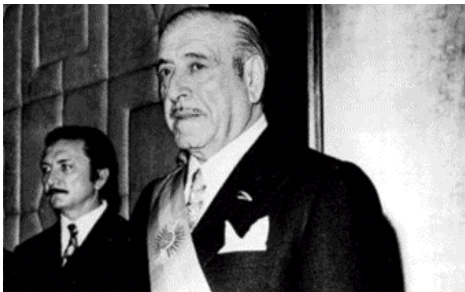
Héctor Cámpora ganó las elecciones en 1973.

¿Cómo estaba viviendo Argentina en el año 1976, qué estaba pasando en ese momento?