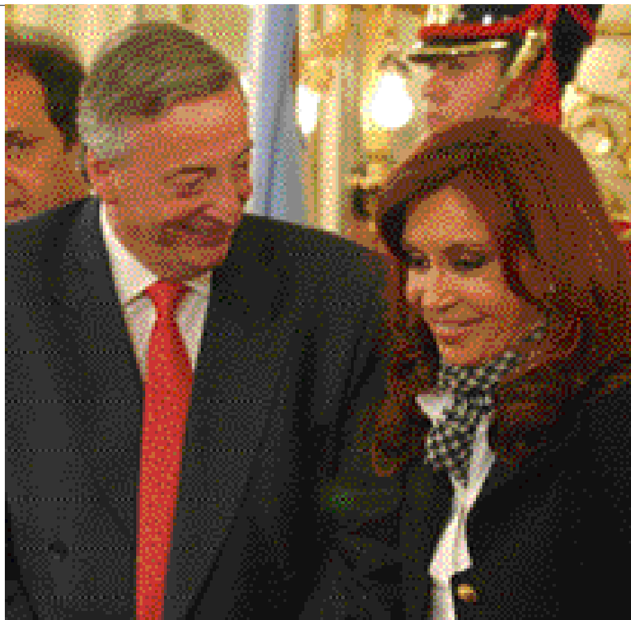
El fallecido Néstor Kirchner y su esposa, la actual presidenta argentina.

Como le había dicho al principio, Alfonsín se ciñó al derecho con sus más y sus menos; la justicia funcionaba, a pesar de que se cometieron numerosos errores jurídicos durante nuestro proceso, como por ejemplo el principio de la no retroactividad, el principio del juez natural que fue vulnerado y otros errores de orden penal, por citar tan solo algunas deficiencias. Todo ello para llevarnos ante ese ‘teatro’ que tuvo difusión mundial, pero así y todo Alfonsín cumplió a su manera. Menem llegó después a la