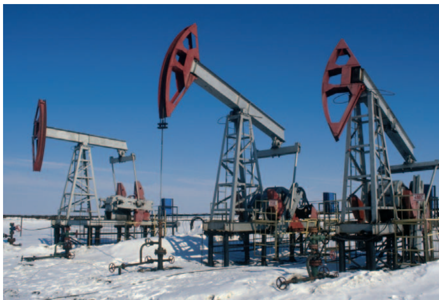
La economía venezolana es dependiente del petróleo.

Así las cosas, y cuando hasta enfermedades desconocidas hasta ahora en un Venezuela, como el virus AH1N1 y el dengue, se reproducen sin control ni acción de la administra-