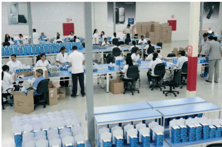
El sector manufacturero de Venezuela sufre ocho trimestres de caídas.

confianza. El esfuerzo merecerá la pena, pues las perspectivas para el país no son nada halagüeñas; una nueva victoria de Chávez sería una catástrofe de impredecibles consecuencias y abriría las puertas a un colapso total de la maltrecha economía venezolana. Sería el peor de los escenarios, pero no se debe descartar. Chávez utilizará todos los medios para ganar la batalla final. ■